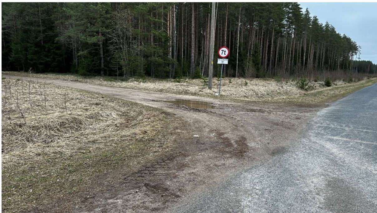
Foto 2. Riigitee nr 17199 km 4,869 ja 9003035 Roostova-Vahunõmme tee ristumiskoht